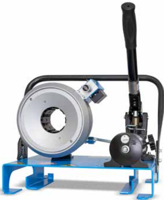
S 2 M

Müssen Werkstätten und mobile Serviceteams auf die Leistungsfähigkeit und Zuverlässigkeit stationärer, großer Pressen verzichten? Definitiv „nein“, meint UNIFLEX und tritt mit seinen kompakten, universell einsetzbaren Werkstattpressen den Beweis an, dass die legendäre Gleitlagertechnik ihre Vorteile auch in leichten, kostengünstigen Geräten ausspielen kann, die in nahezu jedes Fahrzeug und jede Werkstatt passen. Mit einer Vielzahl an Antrieben.