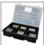
QDS 263 B

S2 Ecoline: S 2 Paket = Maschine + PB Ø 17, 20, 24 + QDS 26X B