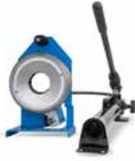
S 2 M Ecoline