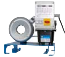
S 2 A