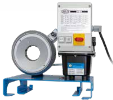
S 2 A