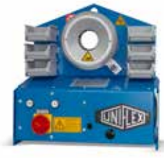
S 2 LA