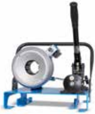
S 2 M H