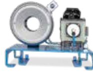
S 2 P