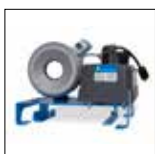
S 2 DC