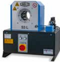
S 3 L Ecoline