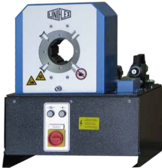
S 3 Ecoline

Durch die schmale, innovative Bauweise, die hohe Anwenderfreundlichkeit, Vielseitigkeit und lange Lebensdauer setzt die S 3 Serie Maßstäbe für Qualität und Wirtschaftlichkeit. Ihre kompakte Bauweise erlaubt ergonomisches Arbeiten. Die langen Grundbacken ermöglichen das Verpressen von 90°-Armaturen bis 1¼ Zoll, die bewährte schmierungsfreie Gleitlagertechnologie senkt Wartungskosten und steigert die Produktionsqualität.