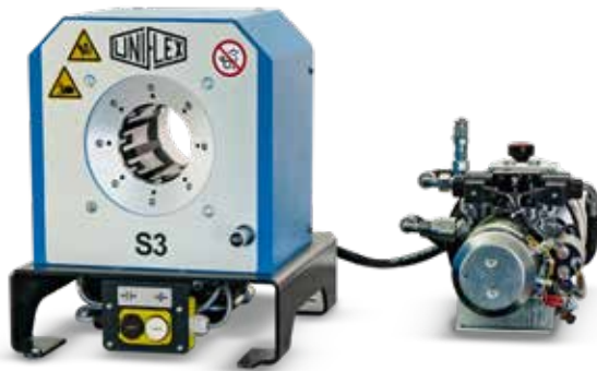
S 3 L Mobileline