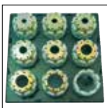
QDS 239 B