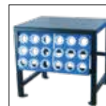
TU Rack PB239