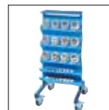
QDS 239 C