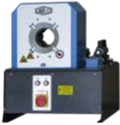
S 3 Ecoline