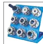
QDS 239 R