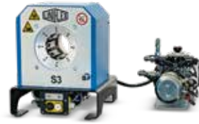
S 3 L Mobileline